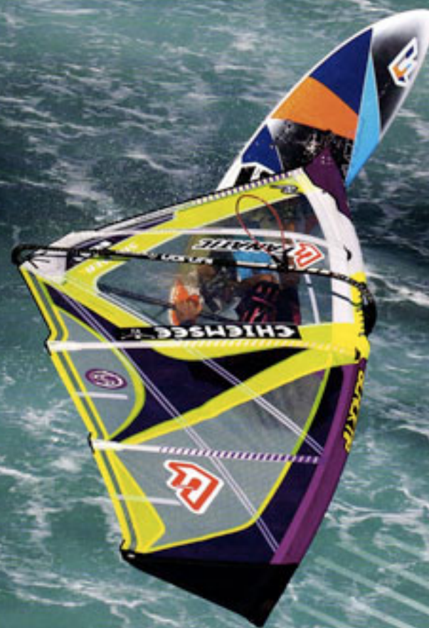
Graham Ezzy en goyler avec la Panther Elite.

Les années passent et, dans le windsurf, l'été reste synonyme de lancement des nouveautés matos, même si certaines marques ont choisi de ne plus renouveler l'ensemble de leurs gammes chaque année. Alors, quoi de neuf dans les shops cet été ? Nous vous avons concocté un tour d'horizon des derniers petits bijoux.