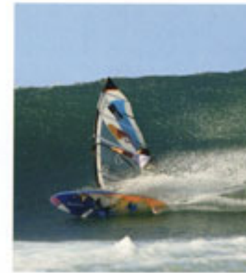
De bijtende rail van Levi's singlefin. Graham benut de manoeuvreerbaarheid van de thruster set-up.

Graham: 'Als het groot is en ik wil down-the-line harde turns maken, kies ik zeker voor mijn single. Maar voor tricks als taKa's is de multifin te gek, dan over het algemeen ga ik voor mijn thruster set-up.'