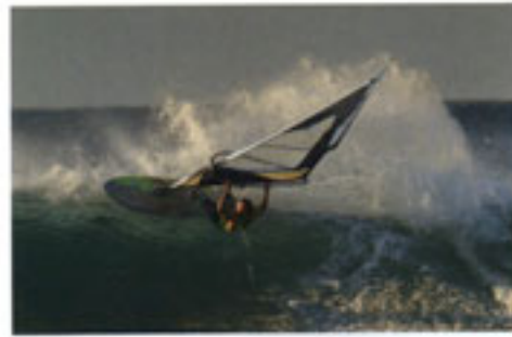
Kauli gebruikt zijn quads altijd en overal. Krachtige aerial van Angulo.