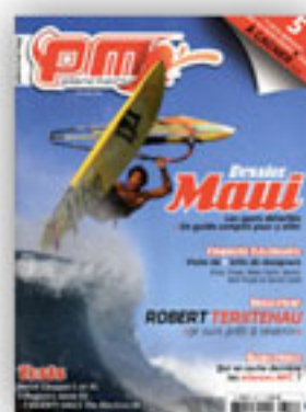
PLANCHE MAG 347 May 2012 France p9